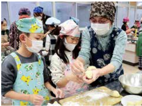
令和6年度郷土料理教室で「あんもちたご汁」を作りました

ら3月中旬まで、スイカは5月から出荷します。農作業は大変ですが、消費者の方に喜んでいただけることを励みに頑張っています。朝から出荷しに行き、まんなの出荷者のみなさんと顔を合わせて笑顔で話すことが、私の楽しみとなっており、元気の源です。 私は女性部に加入して40年以上が経ちます。女性部に入ってきたことは、仲間ができたことです。忙しい日々の中でも時間を