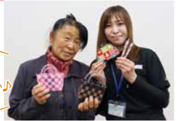
家の光記事活用で小物づくり♡

ら3月中旬まで、スイカは5月から出荷します。農作業は大変ですが、消費者の方に喜んでいただけることを励みに頑張っています。朝から出荷しに行き、まんなの出荷者のみなさんと顔を合わせて笑顔で話すことが、私の楽しみとなっており、元気の源です。 私は女性部に加入して40年以上が経ちます。女性部に入ってきたことは、仲間ができたことです。忙しい日々の中でも時間を