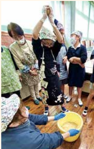
大津町 謹川小学校でみそづくり 5年生が参加