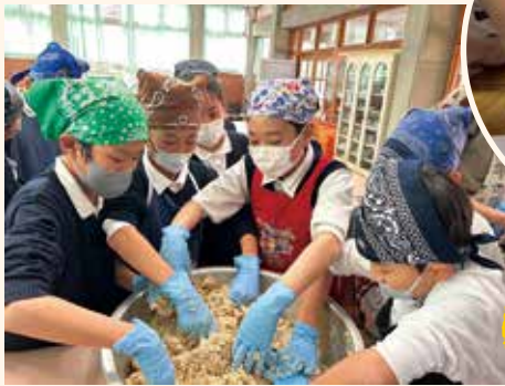
煮た大豆と麩と塩をまぜまぜ