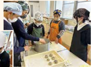
大津町 大津北小学校 郷土料理学習でいきなり団子づくり