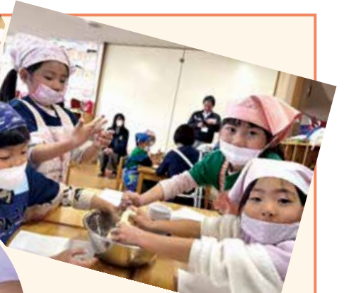
大津町 第2よろこび保育園でいきなり団子づくり