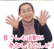
皆さんも活動に参加しましょう♪