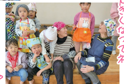
安全安心なものをもたべて大きく育ててね