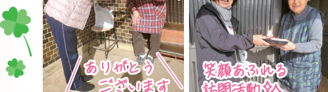
手作りのはし紙やメッセージも添えて♡