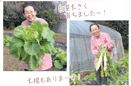
白菜たくさん育ちました～！ 大根もありませう！