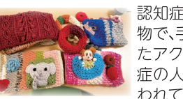
みんなで作ると楽しいよ