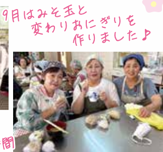
9月はみそ玉と 変わりおにぎりを 作りました♪