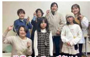
携帯ストラップ作り中

支部活動へのお申込み・お問合せ先 大津中央支所生活課 TEL: 096-293-3213