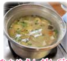
おひめさんだし汁