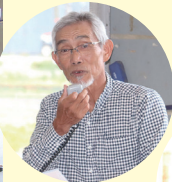
指導員による 栽培管理説明