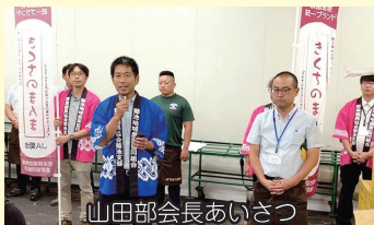
山田部会長あいさつ