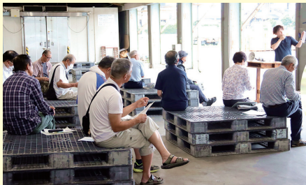
出荷前の栽培管理講習会