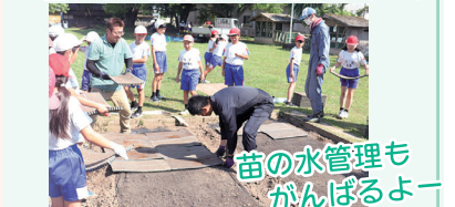
苗の水管理もがんばるよー