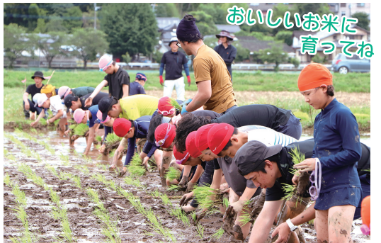
おいしいお米に育ってね

苗を植えた後は、どろどろの田んぼの中で走って棒を取りに行く「田んぼフラッグ」や、魚のつかみ取り大会を行いました。泥とたわむれた子どもたちは「農業の大変さと面白さを知りました！お米を大切に食べたいです！」と泥だらけになりながら笑顔で話しました。