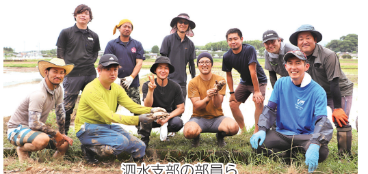
泗水支部の部員ら