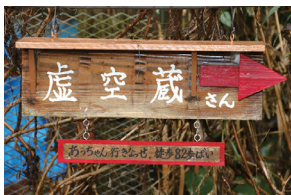
駐車場の看板矢印方向に歩いていくと見えてきます