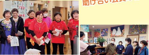
菊陽・助け合いの会 メンバー