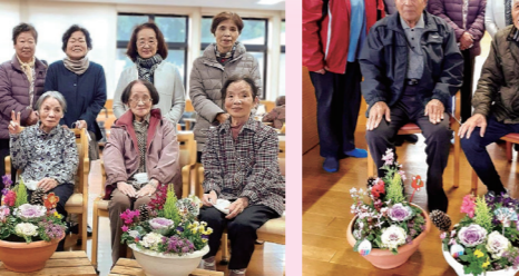
正月用寄せ植えを作って、めくみの里へお届けしました