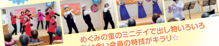
めくみの里のミニテイで出し物いろいろ 助け合い会員の特技がキラリ☆