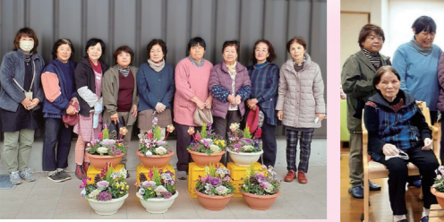
西合志・助け合いの会メンバー