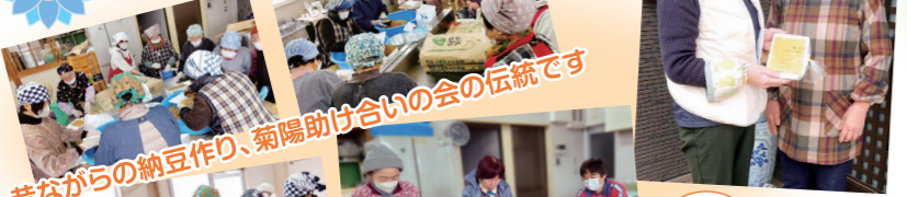
昔ながらの納豆作り、菊陽助け合いの会の伝統です