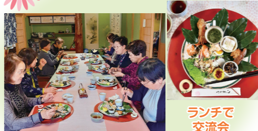
ランチで 交流会 活動の今後について意見交換