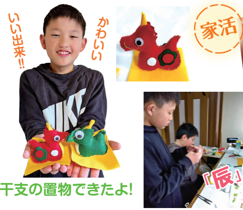
干支の置物できたよ!