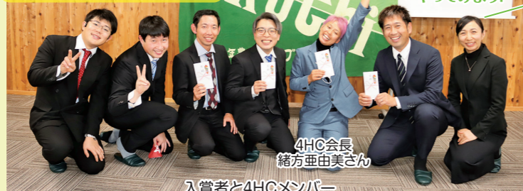
入賞者と4HCメンバー

4HCは、農業に夢と希望を持っている仲間です 視察や研修、BBQ etc... やりたいことに挑戦します