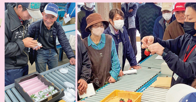
詰め方、規格を確認