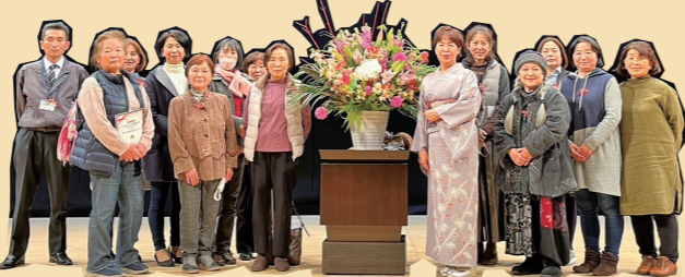
坂本さんと応援団