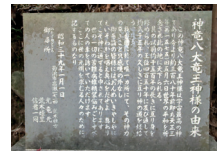
龍王神社由来の石碑