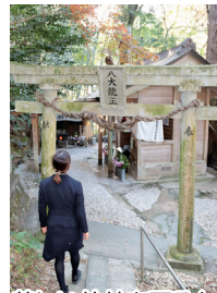
美しい竹林を下ると神社が見えてきます