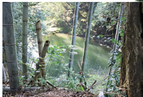
龍が住んでいたといわれる淵 今でも住んでそう〜