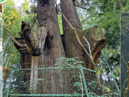
「男龍」の上岸にある「夫婦杉」巨木です!