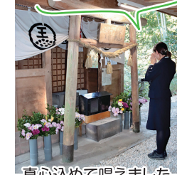
真心込めて唱えました