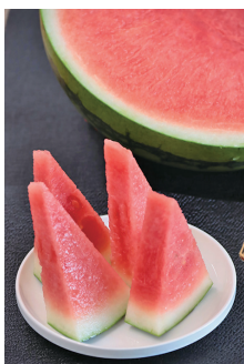
タネが少ないハロウィンスイカ