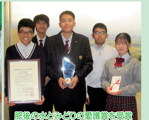
肥後の水とみどりの愛護賞を受賞