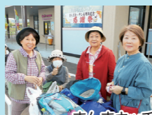
まんまキッチンでひと休み