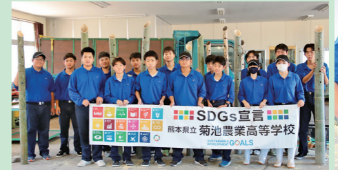
竹灯籠は「熊本暮らしまつり」に使用 地域活性化とSDGsを学びました