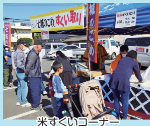
米すくいコーナー