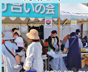
各分会より、おいしいものがいろいろ