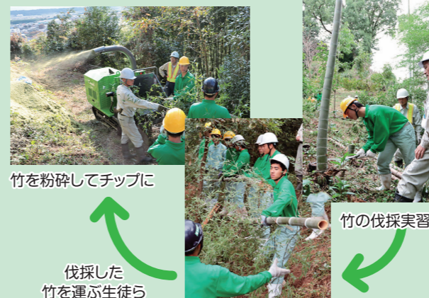
竹を粉碎してチップに