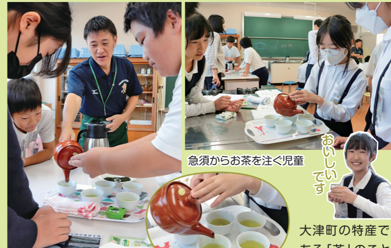
急須からお茶を注ぐ児童