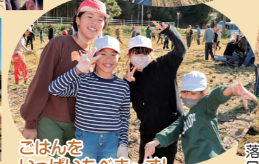
ごはんをいっぱい食べま〜す!