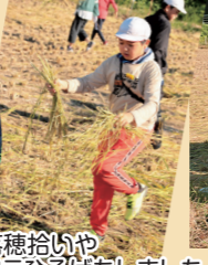
落穂拾いやワラひろげもしました