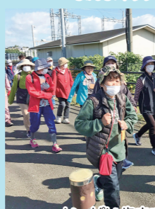
いっぱい歩きました〜!