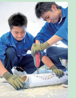
電動ドリルで竹に穴をあける生徒ら