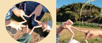
子どもたちが喜びを指で表現してくれました