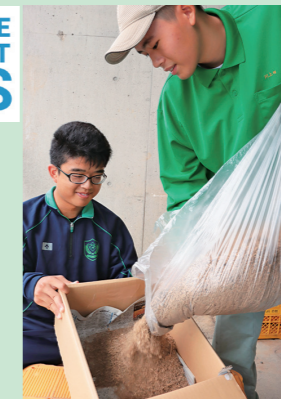
竹チップコンポスト

放置されている竹林問題の解決に向けてSDGs研究班(農業科)を中心に、竹を「農」「食」「環境」に活用し、持続可能な地域づくりに貢献しようと4年前からいろいろな取り組みを行っています。