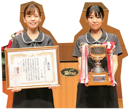
表彰状を手にする北原さん(左)