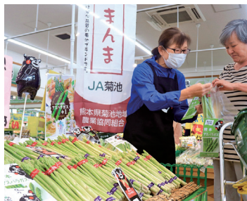
熊本市で試食宣伝販売