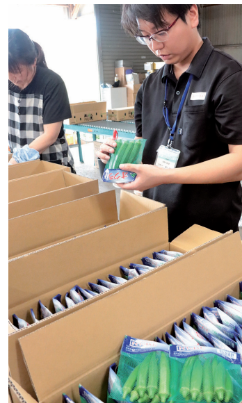
出荷前に厳しいチェック