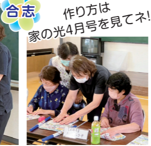
合志 作り方は 家の光4月号を見てネ!