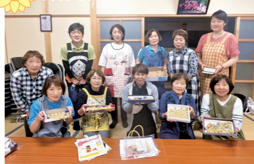
ゴキブリ団子&調理器具講習会