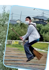
オリーブ園で 飛んだよ!