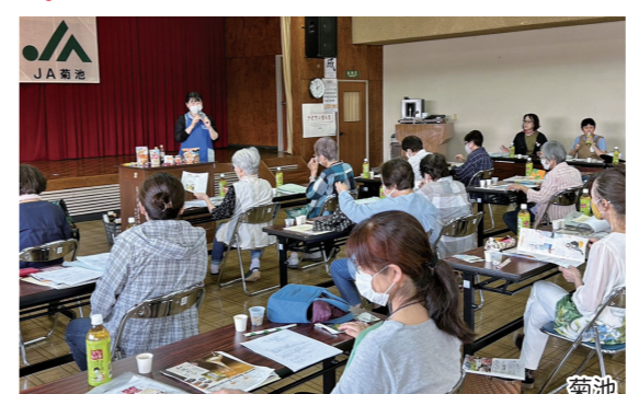
だしの素 漬物の素