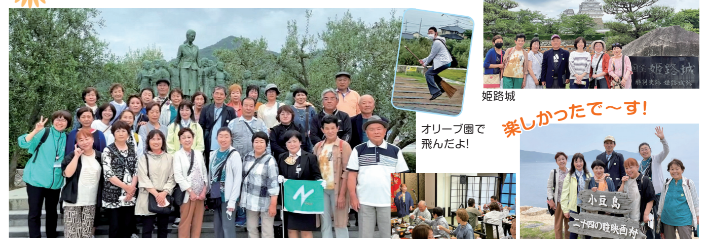
香川県 小豆島・二十四の瞳像前で記念撮影