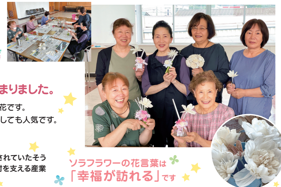
ソラフラワーの花言葉は 「幸福が訪れる」です

*ソラの木は、昔はタイの農地では邪魔者にされていたようですが、お花に加工されるようになり、今では村を支える産業になっているところもあるそうです。