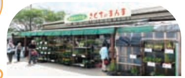
さくちのまんま菊陽店