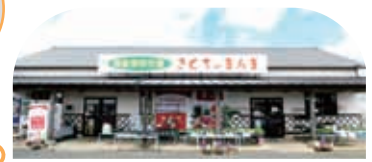
さくちのまんま菊池店