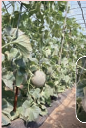
メロンの立体栽培に挑戦!